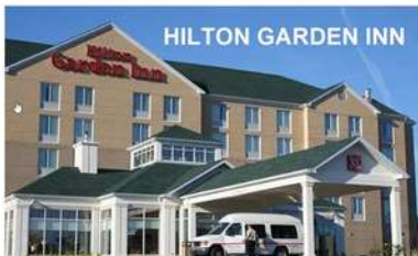
HILTON GARDEN INN